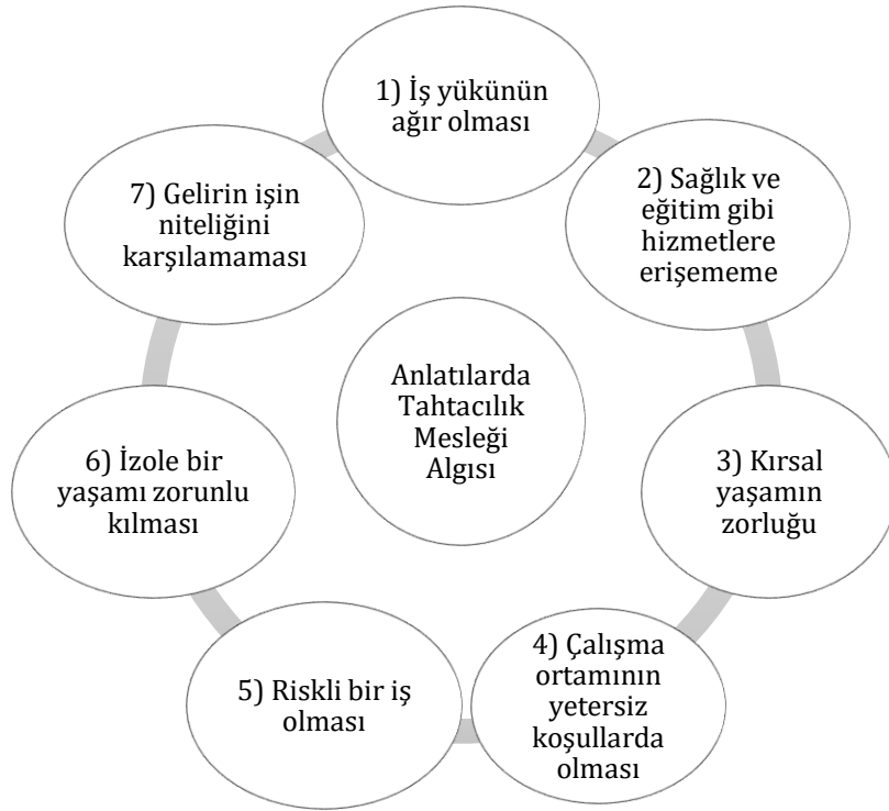
Şekil 1. Anlatılarda Tahtacılık Mesleği Algısı

Tahtacılık mesleğinin pek çok zorlukları ve riskinin olması bireylerin bu işi terk etmelerinin nedenlerinden biri olarak ifade edilmiştir. Herhangi bir sosyal güvencenin olmaması ise en önemli problem olarak kabul edilmektedir. İşin tehlikeli olması, can güvenliğinin olmaması, ormanlarda yaşam koşullarının zor oluşu, eğitim, sağlık gibi hizmetlerin yetersiz olması, bireylerin kurumlara uzak kalışı ve aile olarak çalışmanın gerekliliği gibi unsurlar bu zorluklar arasında sayılabilir niteliktedir.